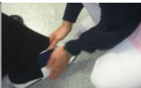
神経障害体験スリッパ