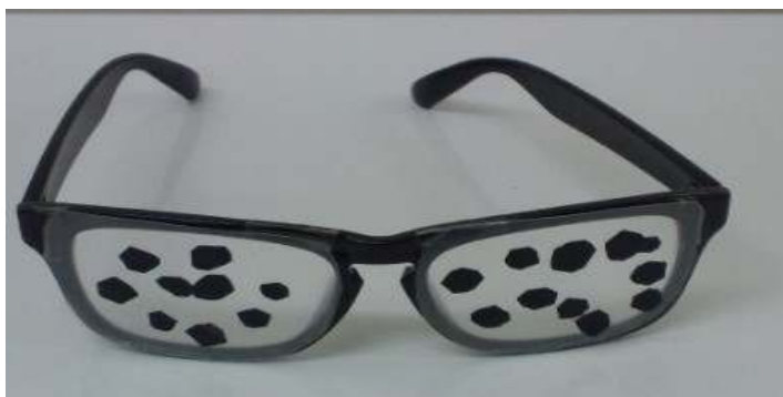
看護師手作り網膜症体験メガネ